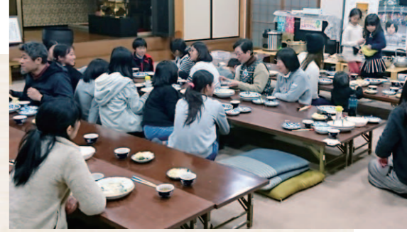
▲ビハーラ子ども食堂(彦根市)

※2 子ども食堂 貧困家庭や孤食の子どもに対し、食事や安心して過ごすことのできる場所を提供することを目的に始められた社会活動で、最近では地域のすべての子ども、親、地域の大人など、対象を限定しない食堂も増えていきます。地域のボランティアなどで運営し、公民館等の公的施設で月1～2回程度開催の食堂が多いです。 ※3 子どもの笑顔はぐくみプロジェクト 滋賀県社会福祉協議会が事務局となり、知事や県経団連会長等が呼びかけ、スポンサーを募集し、子ども食堂支援を中心に子どもを守ることを目的としたプロジェクト。