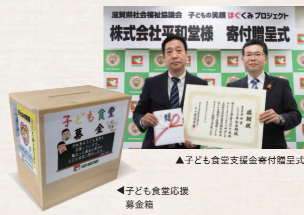
▲子ども食堂支援金寄付贈呈式

子ども食堂には毎回多くの子どもたちが訪れ、はじめは緊張して口数の少ない子どもも、回をかさねるうちに打ち解けていき、異年齢の子と遊んだり小さな子の面倒をみてくれたりと笑顔がどんどん増えています。ここを訪れる子どもたちにとって“ほっ”と安心できる場所であるとともに、こうした取組みを通して困っている人を放っておかない地域づくりに、今後も貢献していきたいと考えています。