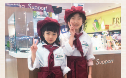
▲終了後には店長から子どもたちに「修了書」を授与させていただきました。