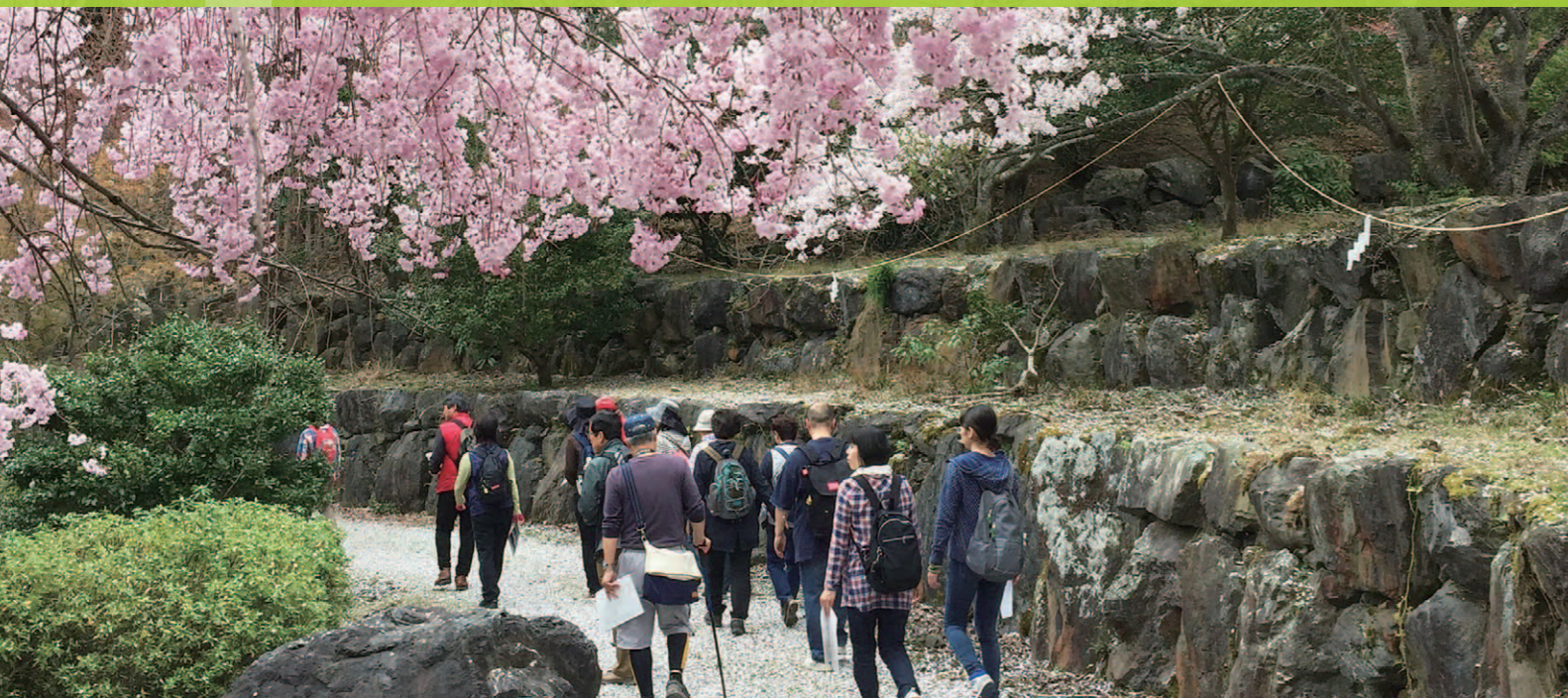
▲2018年4月6日実施:じもとりっぷ彦根の様子